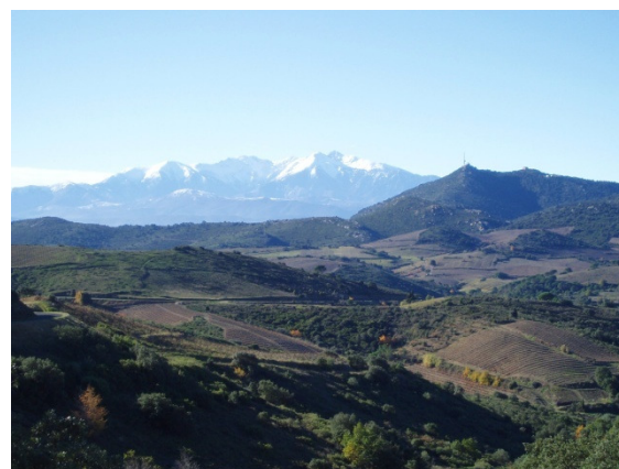
Canigou von der D18 aus gesehen