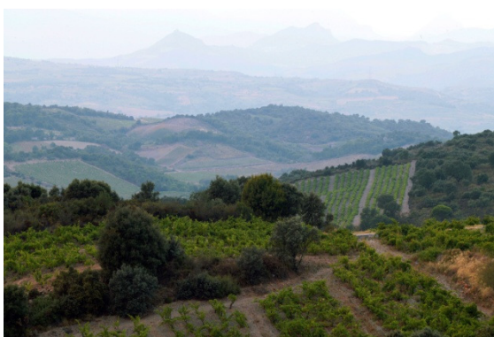
Bugarach im Nebel von der D18 aus

Wenn man die Straße zwischen Calce und Col de la Dona schon einmal gefahren ist, sagt man sich, dass sie schon den Namen einer Cuvée wert ist. Und besonders diese, die ausschließlich auf einer Auswahl der schönsten Stücke Grenache blanc und gris basiert. Diese Rebsorten haben uns 2001 so begeistert, dass wir Lust hatten, ihre ganze Fülle und Komplexität zum Ausdruck zu bringen, um daraus einen großen Wein zu machen. Diesen Wein während 12 bis 16 Monaten im Holzfass auszubauen scheint uns Mindeste zu sein, um die Dichte dieser schönen Trauben zu begleiten.