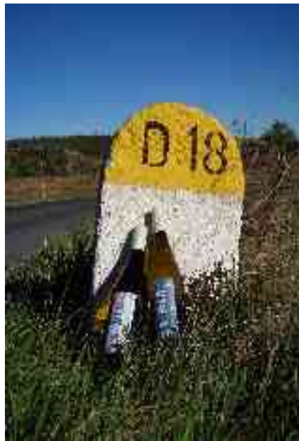
D18 for ever