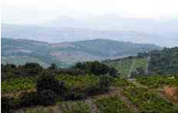
Bugarach im Nebel von der D18 aus

Wenn man die Straße zwischen Calce und Col de la Dona schon einmal gefahren ist, sagt man sich, dass sie schon den Namen einer Cuvée wert ist. Und besonders diese, die ausschließlich auf einer Auswahl der schönsten Stücke Grenache blanc und gris basiert. Diese Rebsorten haben uns 2001 so begeistert, dass wir Lust hatten, ihre ganze Fülle und Komplexität zum Ausdruck zu bringen, um daraus einen großen Wein zu machen. Diesen Wein während 12 bis 16 Monaten im Holzfass auszubauen scheint uns das Mindeste zu sein, um die Dichte dieser schönen Trauben zu begleiten.