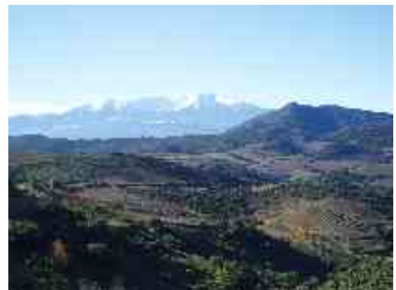
Canigou von der D18 aus gesehen