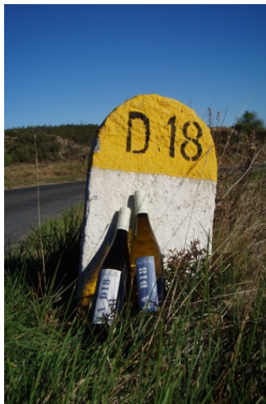
D18 for ever

Production : 2500 bouteilles Rendements : 10hl/ha Surface : 2 ha