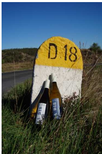
D18 for ever

Production : 1 500 bouteilles Rendements : 10hl/ha Surface : 2 ha