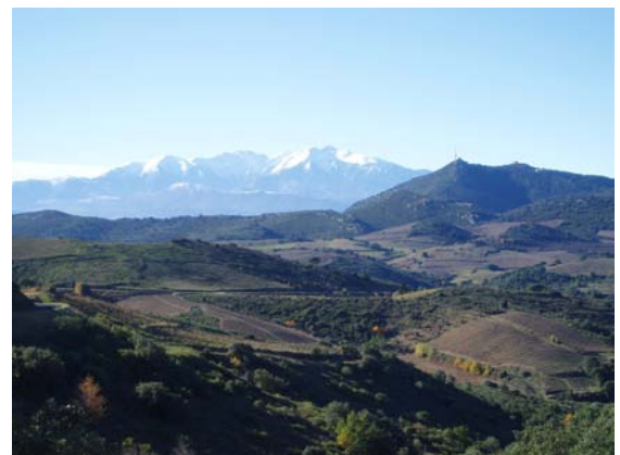
Canigou von der D18 aus gesehen