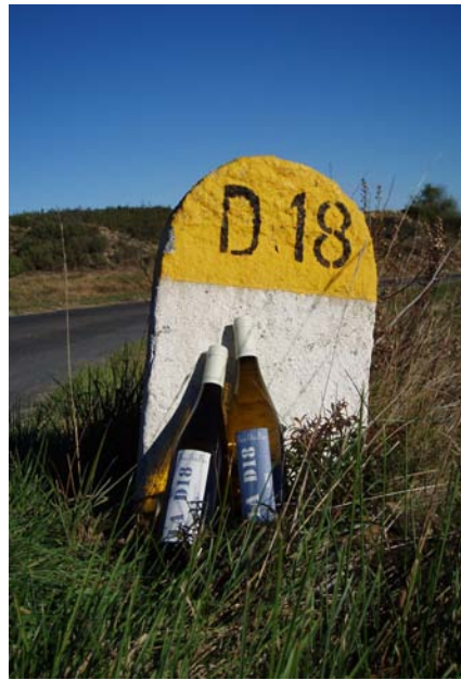
D18 for ever