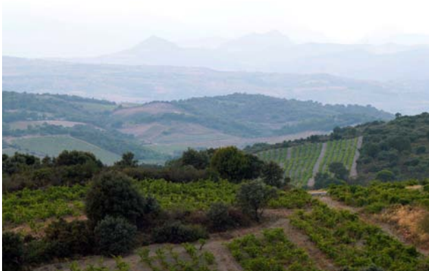
Bugarach im Nebel von der D18 aus

Wenn man die Straße zwischen Calce und Col de la Dona schon einmal gefahren ist, sagt man sich, dass sie schon den Namen einer Cuvée wert ist. Und besonders diese, die ausschließlich auf einer Auswahl der schönsten Stücke Grenache blanc und gris basiert. Diese Rebsorten haben uns 2001 so begeistert, dass wir Lust hatten, ihre ganze Fülle und Komplexität zum Ausdruck zu bringen, um daraus einen großen Wein zu machen. Diesen Wein während 12 bis 16 Monaten im Holzfass auszubauen scheint uns das Mindeste zu sein, um die Dichte dieser schönen Trauben zu begleiten.